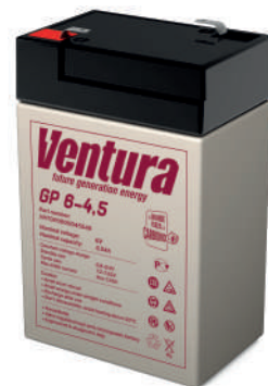
Габаритные размеры, мм